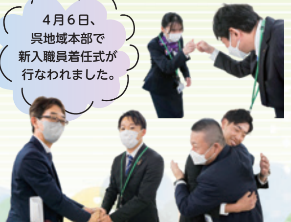
▲支店長に迎えられ笑顔に