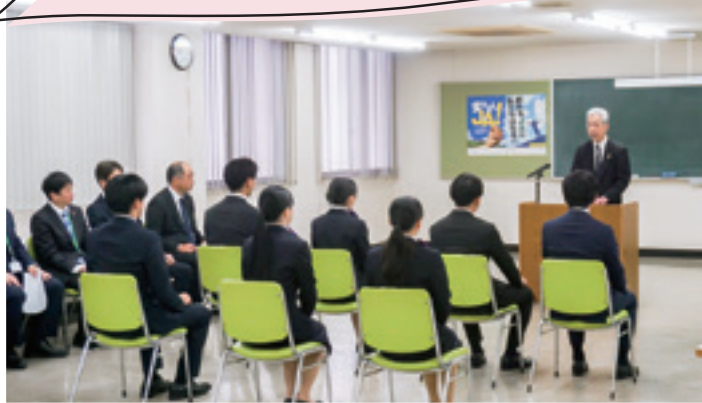
▲大下常務から激励を受ける新入職員